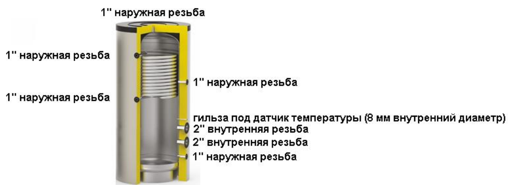
Схема бака серии AT Electro MONO